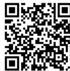
接続用 QR コード