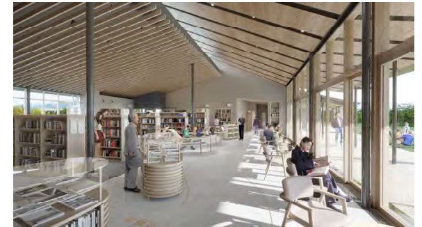
【閲覧室(一般)・本のみち】