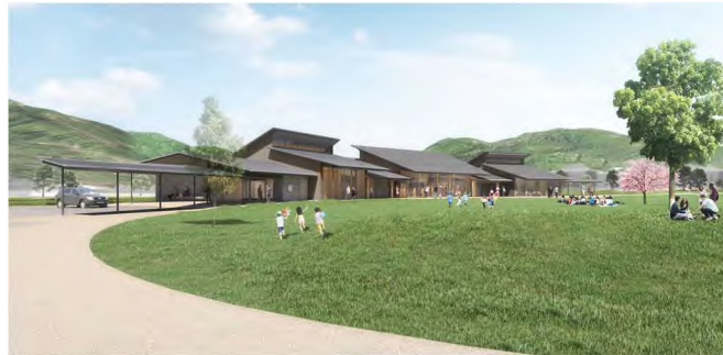
【敷地南西より建物を望む】