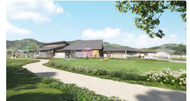
【敷地北西より建物を望む】