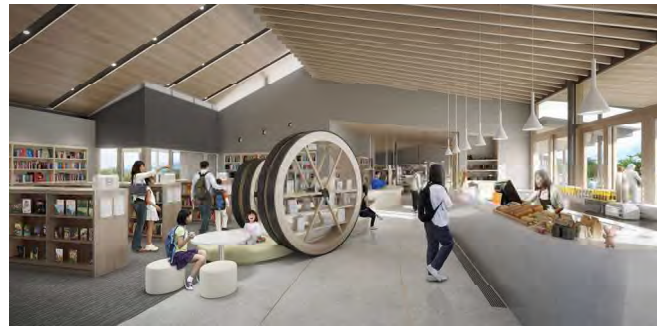
【閲覧室(児童・子育て)・カフェ】