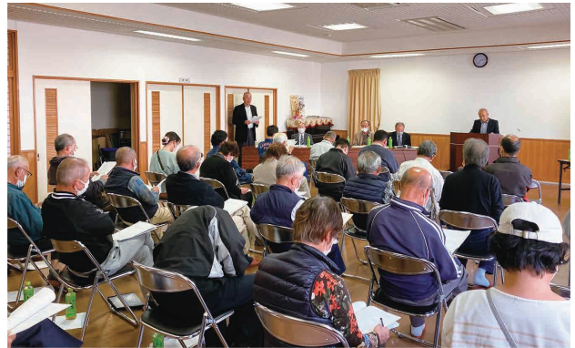
▲小田原ブロック設立準備会総会