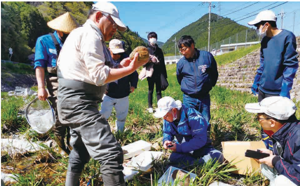
▲越知谷発電所復興調査事業水生動物調査

～2021年10月、2022年4月、10月、2023年9月に続く第5弾です。～ 今後、各ブロックの活動内容を随時紹介していきます。