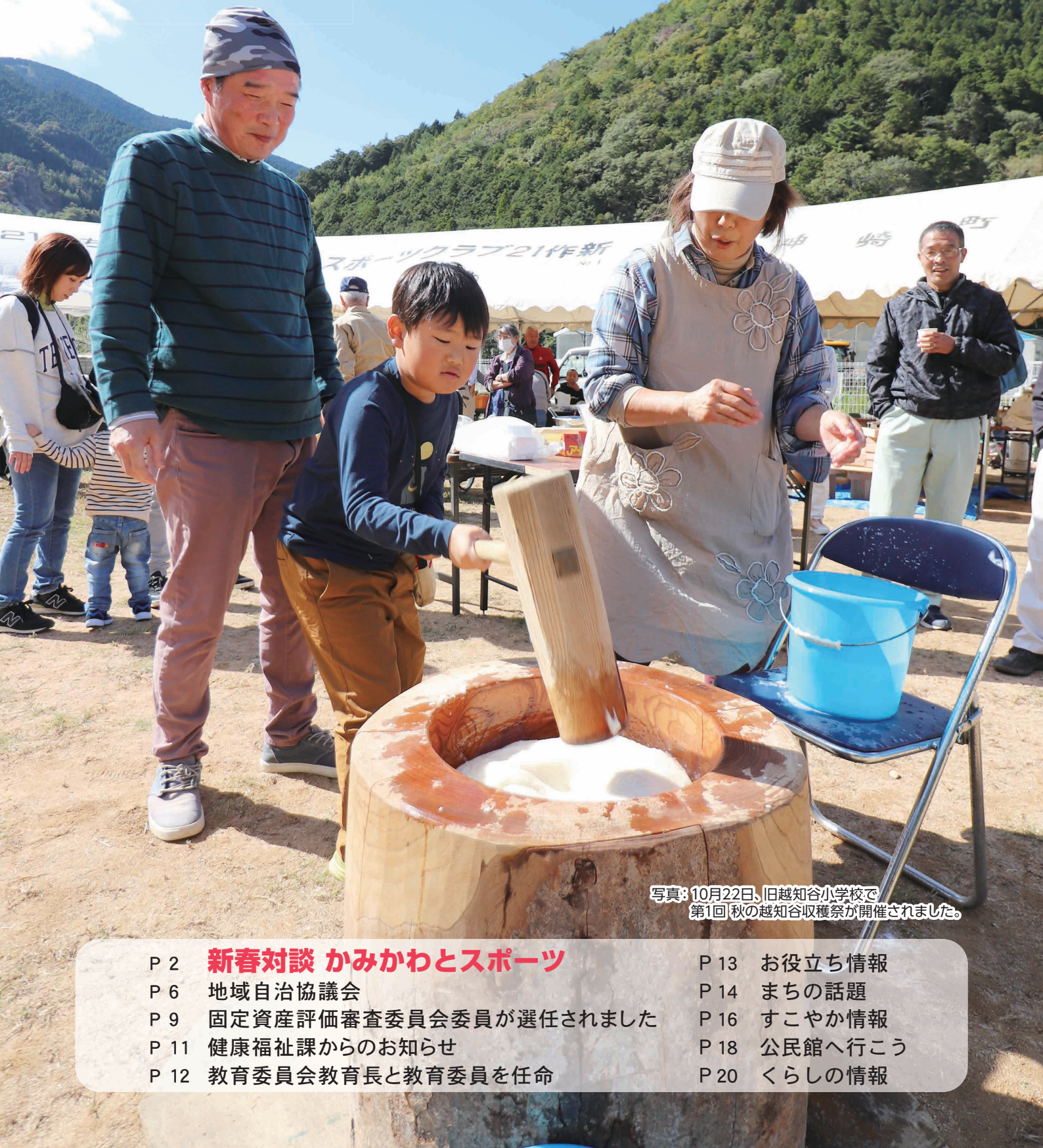
写真：10月22日、旧越知谷小学校で 第1回 秋の越知谷収穫祭が開催されました。