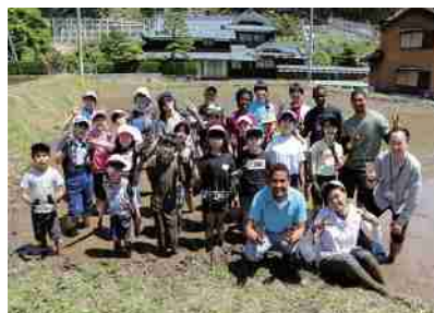
▲田植え初体験の留学生と長谷小学校の子どもたち