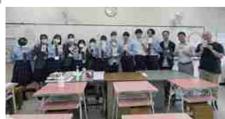
▲カナダ人住民と交流した神崎高校の生徒たち

のことに関心を持ってくれました。現在、国際交流事業に協力して下さる外国人の方を探しています。もし周りに興味がありそうな外国人の住民の方がいらっしゃたら教えてください!また、地域イベントで異文化を取り入れたい、台湾人観光客の受け入れなどについて一緒に考えたいという方もぜひご連絡ください!