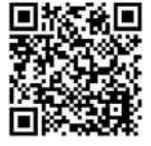
兵庫県電子申請システム