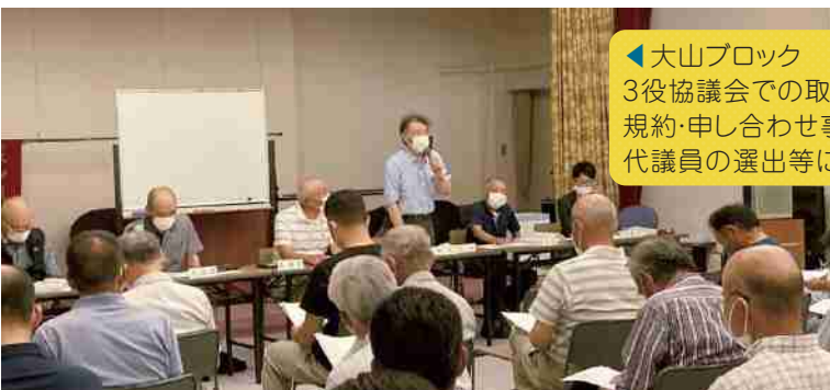
◀大山ブロック 6/17各種団体合同説明会(吉富集落センター) 3役協議会での取り組み経過、各区課題抽出とまちづくり計画、規約・申し合わせ事項、準備会立上げに向けたスケジュール、代議員の選出等について提案・協議が行われました