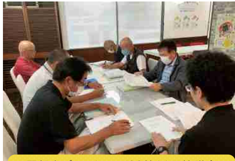
▲粟賀南ブロック 7/28第11回協議会(「かみかわ移住定住サポートセンター」)