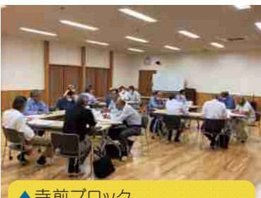
▲寺前ブロック 6/19第10回協議会(寺前地域交流館)