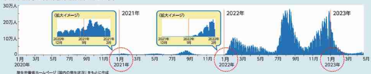
〈日本国内の新規感染者数(1日ごと)〉

これまで3年間、年末年始に新型コロナは流行しています。 令和5年秋以降、重症化リスクの高い高齢者等にはXBB対応ワクチンの接種をおすすめします。 若い方にも接種を受けていただけます。