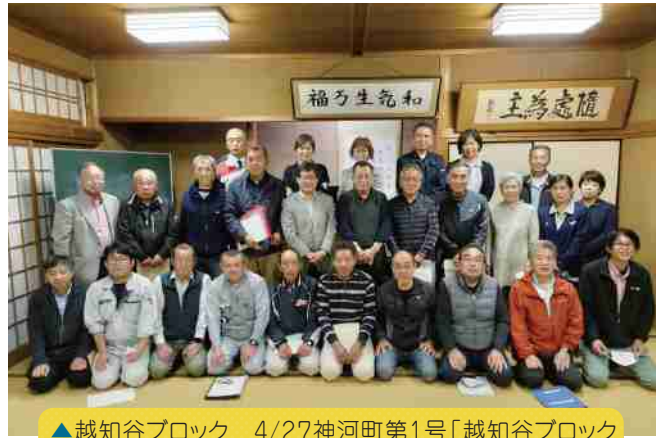
▲越知谷ブロック 4/27神河町第1号「越知谷ブロック地域自治協議会」が設立(大畑コミュニティセンター)