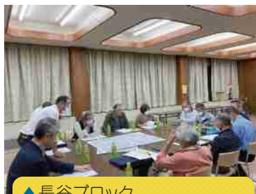
▲長谷ブロック 5/16第8回協議会(センター長谷)