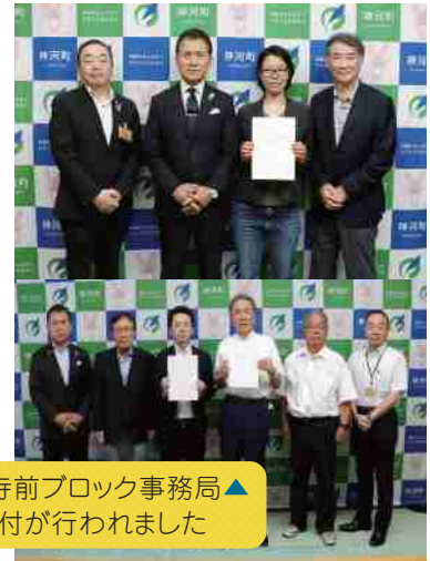
6/2大山、7/4粟賀南、寺前ブロック事務局▲ 集落支援員に委嘱書交付が行われました