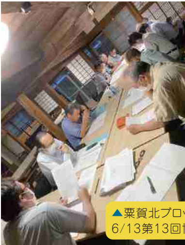
▲粟賀北ブロック 6/13第13回協議会(粟賀の驛)