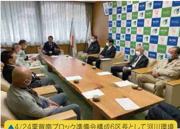
▲4/24粟賀南ブロック準備会構成6区長として河川環境整備の取組に係る兵庫県および神河町への要望書の提出

越知谷ブロックで活動開始、他の6ブロックで6年度設立に向けて協議が進められています