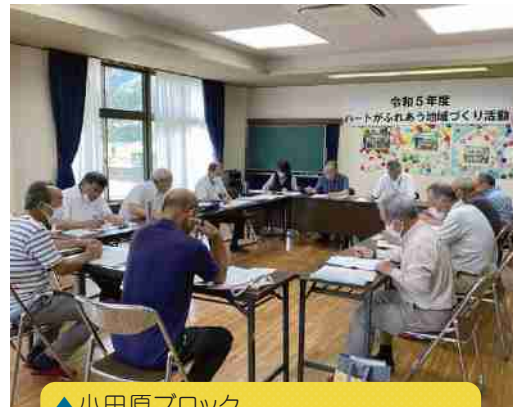
▲小田原ブロック 7/24第13回協議会(高朝田農事集会所)