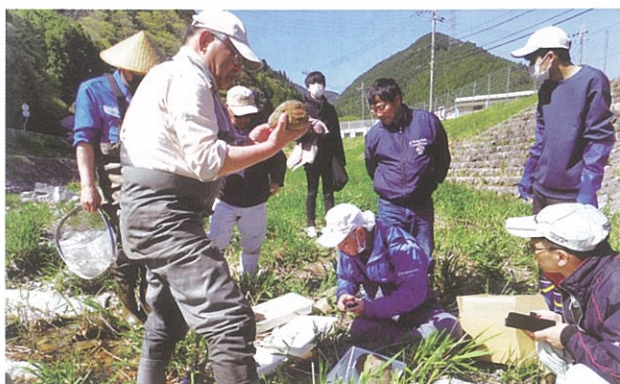
▲越知谷発電所復興調査事業水生動物調査

～2021年10月、2022年4月、10月、2023年9月に続く第5弾です。～ 今後、各ブロックの活動内容を随時紹介していきます。