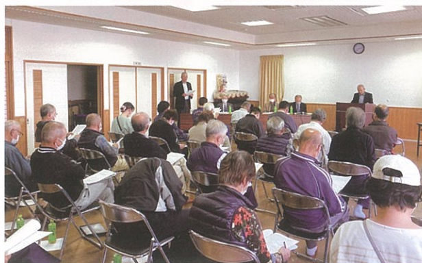
▲小田原ブロック設立準備会総会