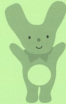
カーミン 神河町マスコットキャラクター