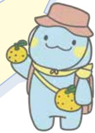
オッチー (越知谷エリア)