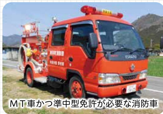
MT車かつ準中型免許が必要な消防車

A 未更新の消防車の中にはMT車（マニュアルミッション車）かつ準中型運転免許が必要なものがある。消防団員の誰もが消防車を運転できるように運転可能な免許証を取得する必要がある。