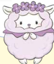
オーヤン (大山エリア)