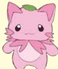
さくみゃん (粟賀南エリア)