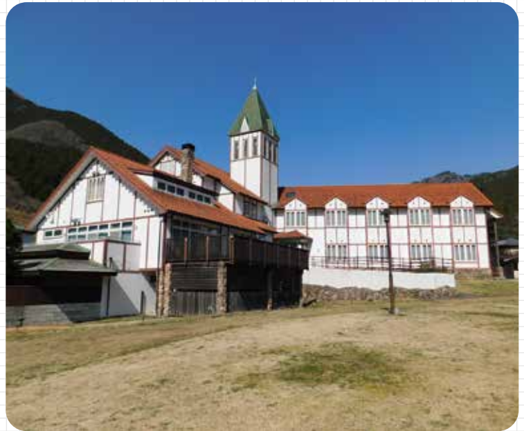
令和8年1月15日から休館しています

A 修繕計画等で将来的なコストも見込んでおく必要がある。その辺りもしっかり精査した上で方向を決めたい。