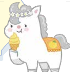
シルバ (粟賀北エリア)