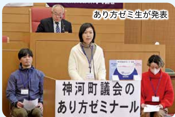
あり方ゼミ生が発表