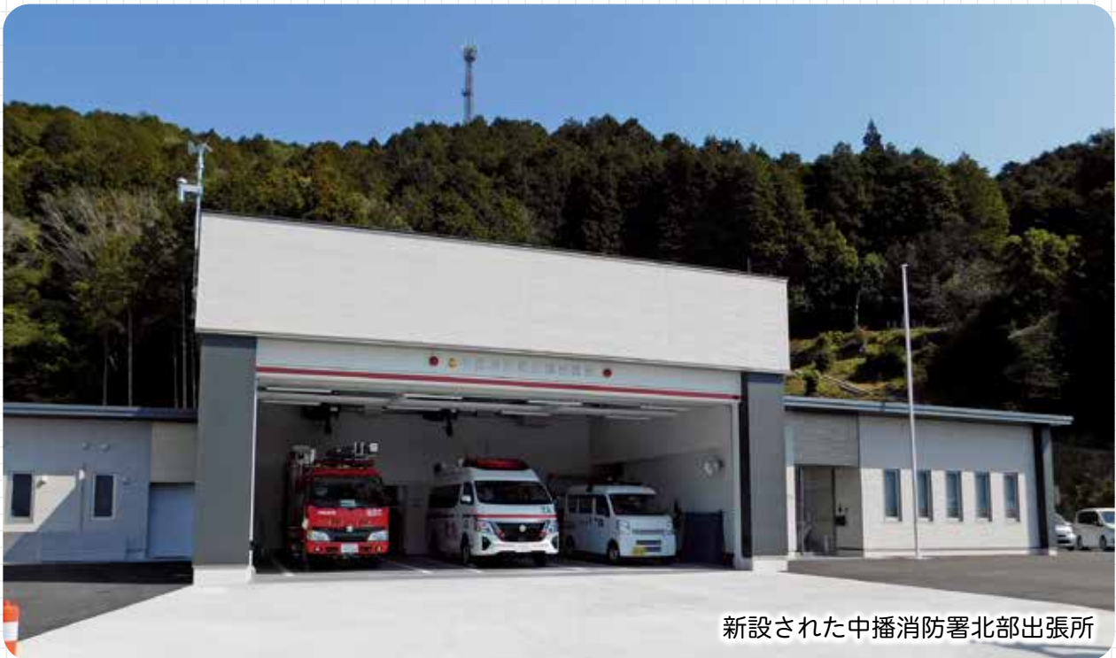
新設された中播消防署北部出張所

完成後、3月1日に竣工式が行われ、3月2日から運用を開始しています。今後もこの出張所が地域の安全と安心に寄与されることを願います。