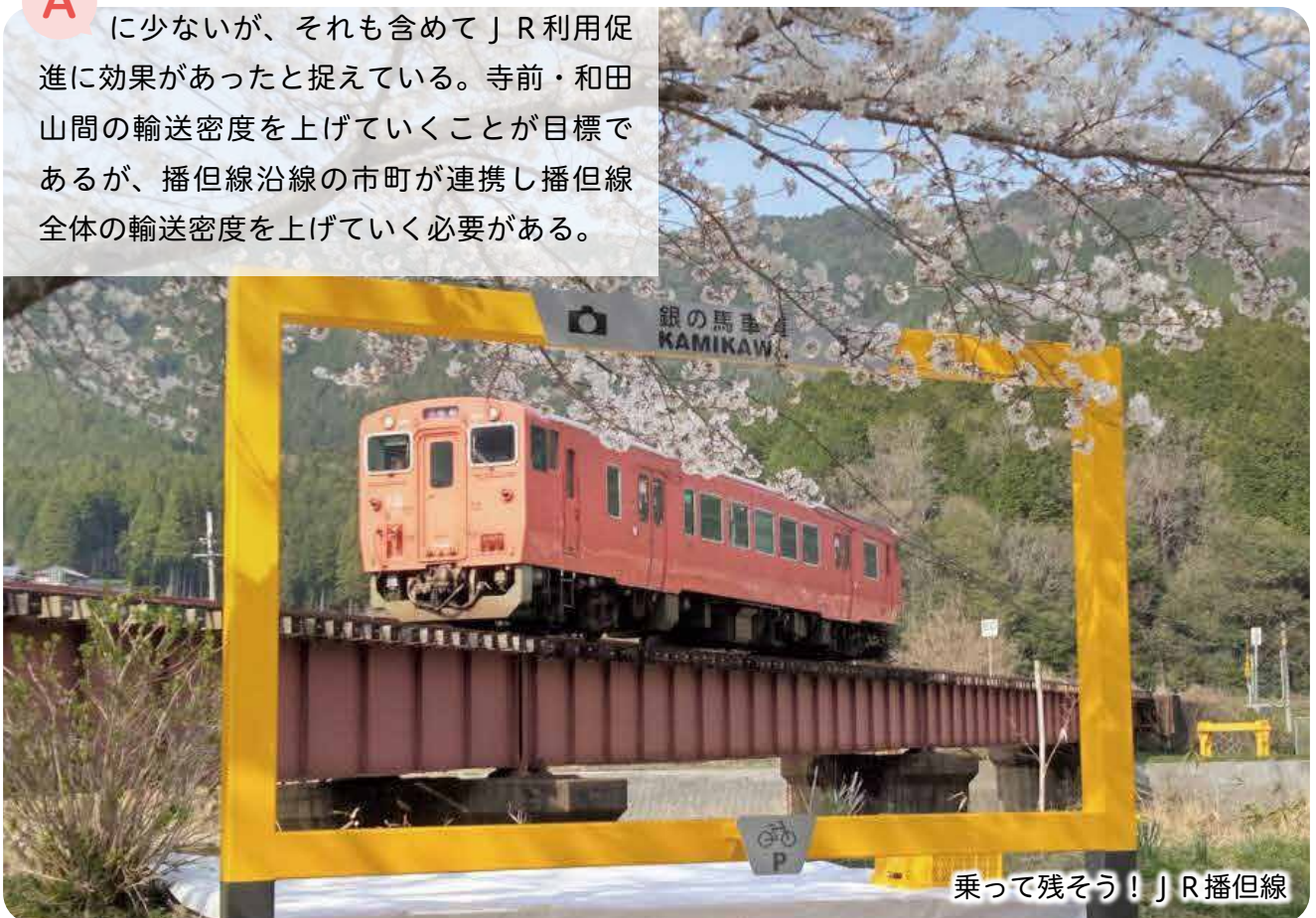
乗って残そう！JR播但線

A 令和8年度から再スタートするが、年度ごとに評価し、新たな施策も検討していきたい。