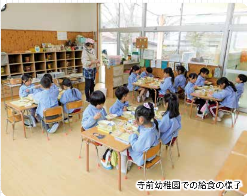
寺前幼稚園での給食の様子

本来、保護者が負担する給食費は5,300円ですが、町の方針で保護者負担を増やさないようにするため、3,850円を超える分は町が負担してきました。