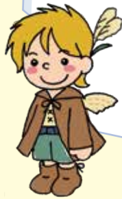
ススのん (長谷エリア)