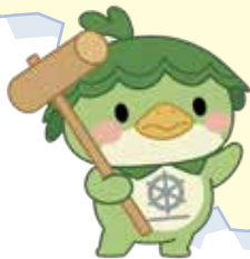
こっとな丸 (寺前エリア)