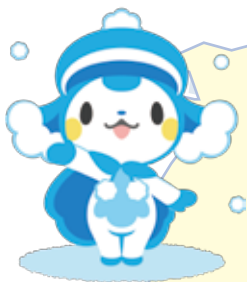
スノール (小田原エリア)

3月20日、寺前駅前広場でカーミンの春まつりが開催され、多くの方が見守る中、カーミンの新たな仲間たちが発表されました。町内を7エリアに分けて、それぞれの地域の特徴を生かした妖精7体が誕生しました。表紙は、カーミンと会場の方で新しい仲間の誕生をお祝いした様子です。