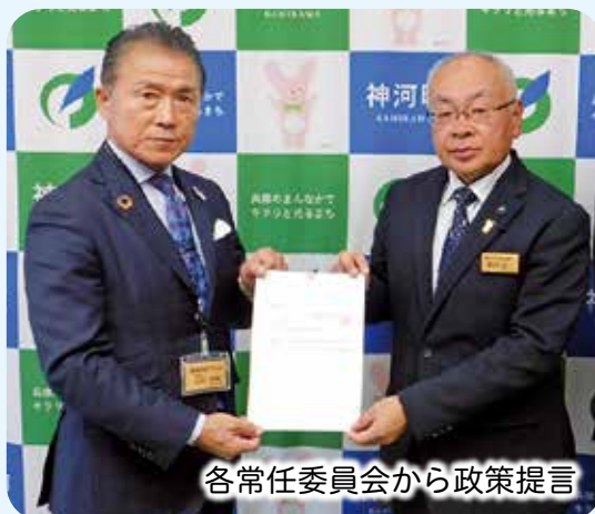
各常任委員会から政策提言