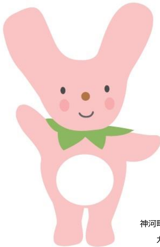
神河町マスコット カーミン