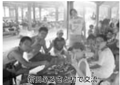
新田ふるさと村で交流