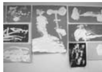
ケアステーションの壁の“花”

ケアステーションでは、これからも「自分が好きになれる」、「自分に自信が持てる」、そんな子どもに育てほしいと願いつつ、支援していきたくて考えています。