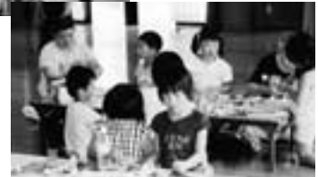
貯金箱作りに挑戦▶