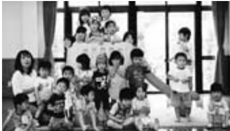
◀ふれあい教室 “はい、チーズ”