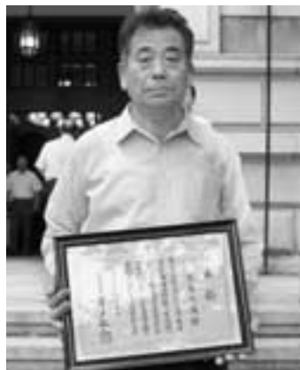
大会に出席し、代表として表彰を受けられた町委員会・児島会長