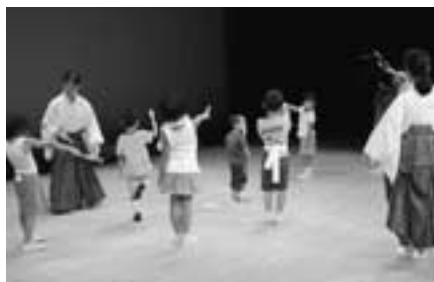
剣士舞教室(昨年度)