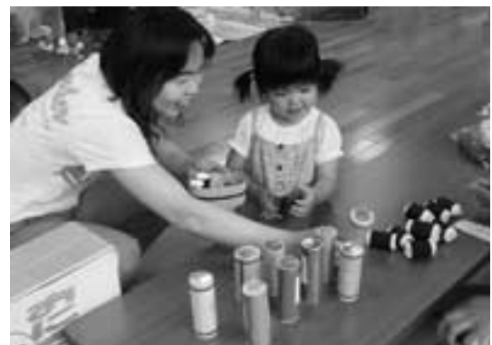
にこにこタイム(お買い物ごっこ) 「どのジュースにしようかな」