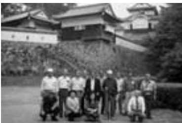
古文書教室館外研修 (備中高梁市)

8月30日(木) 8:00 ~ 10:00 神崎公民館・神崎体育センター周辺 環境美化活動