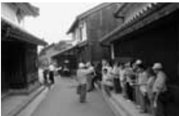
高齢者大学館外研修 (今井町 石舞台 高松塚)