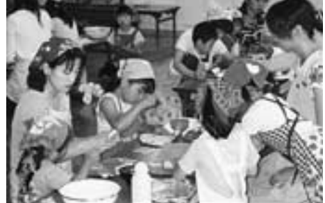
あつあつピザ作り