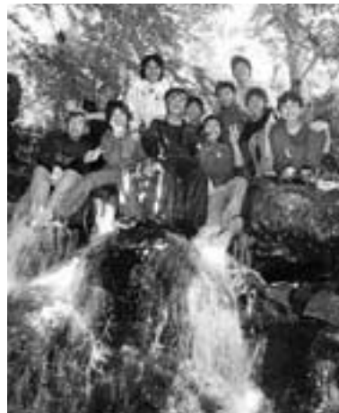
やまびこ学園生による溪流探検の様子 (登った滝の上で記念撮影) 6月23日作畑(越知川支流)にて

夏休み短期山村留学 2期 8月17～22日(5泊6日) 第2回週末ミニ山村留学 9/15(土)～17(月)(2泊3日) この他、夏休み短期1期(4泊5日) 長期ふるさと体験留学(13泊14日)の受付は終了しました。秋以降の週末、冬休み、春休みの企画も、募集開始次第、広報・ホームページ等でお知らせ致します。