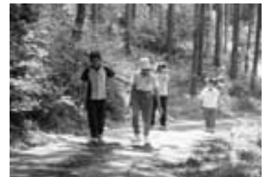
もう一息だ。がんばれ!

これからもケアステーションでは、家庭とは違う子どもたちのいろんな表情を保護者の方にお知らせしていきたいと思えます。