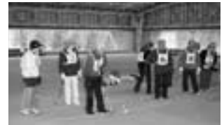
若返り(ゲートボール)