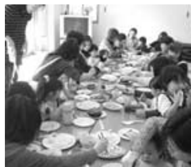
みんなで食べるとおいしいね! (節分遊びと手巻き寿司)