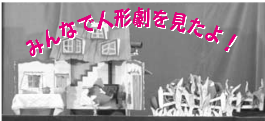
歳末助け合い募金配分事業(社会福祉協議会)で、小さい子どもたちに人形劇を観せていただきました。(人形劇団『クラルテ』公演)

とき 3月16日(火) 10:00～11:30 ところ 大河内保健福祉センター 対象 子育て中の保護者と子ども(おじいちゃん・おばあちゃんもお孫さんと一緒にどうぞ) 内容 お誕生会は1～3月生のお友だちです。ダンス・手遊び他...、1年間の成長をみんなでお祝いします。 参加費 無料 持ち物 お茶