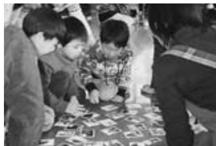
昨年のかるた大会の様子