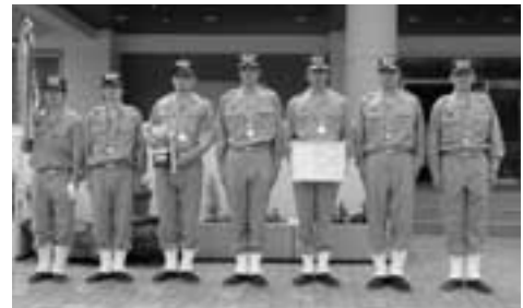
ポンプ自動車の部優勝 大畑分団