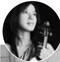
エウフォニカ管弦楽団と 川井 郁子

(当日券は500円増し、完売の時はご容赦願います。) (座席は全席指定。お早めにお求めください。)