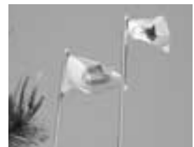
にかほ市に揚がった神河町旗