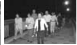
身近で取り組みやすいウォーキング。町内で約2,200人の方が歩かれました。