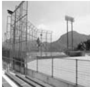
はにおか運動公園