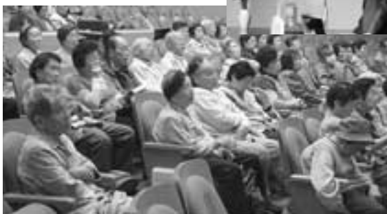
熱心に受講中の高齢者大学生