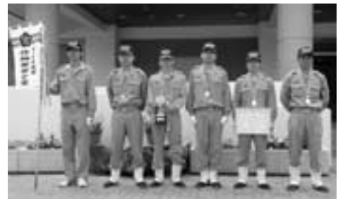
小型ポンプの部優勝 作畑新田分団