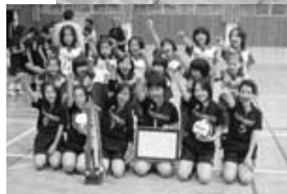
優勝した福本ハッピーセット