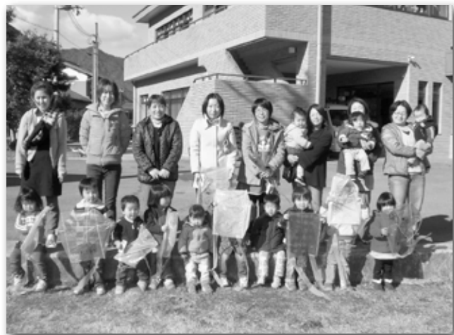
2歳児グループ「たこあげしたよ。」