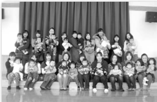
0歳児グループのお友だち

※子どもの大好きな玩具・絵本がいっぱいです。子育て相談も受け付けています。子育て中の方ならどなたでも参加できますので、お気軽にお越しください。