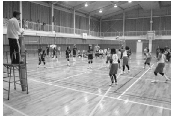
ジュニアバレーボール大会の決勝戦