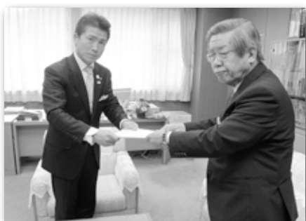
委員長から町長に仕分け結果を報告