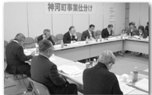
事業仕分けの様子

事業の概要 自然災害及び火災等緊急情報の提供、農業・農村の活性化と産業の振興に寄与する情報の提供、行政情報の提供、自主制作番組の放送、インターネット接続などの実施。