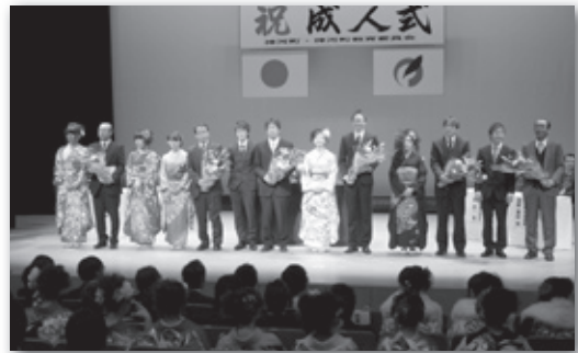
恩師の先生方と花束贈呈者の記念撮影