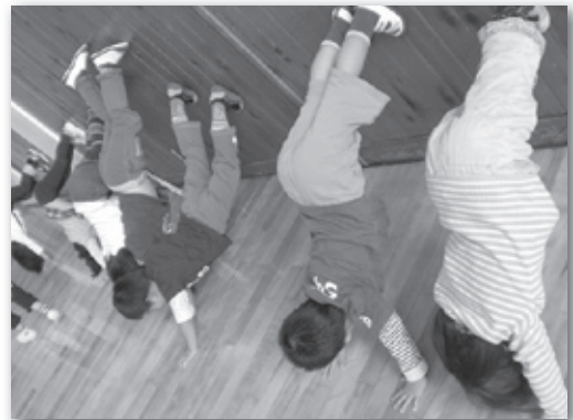
(親子ハッピー体操 逆立ちもできるよ)