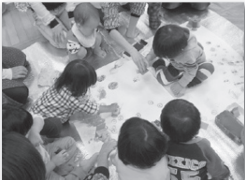
(1歳児グループ スタンプ遊び)

と き 2月25日(月) 10:00～11:30 ところ 大河内保健福祉センター 対 象 子育て中の保護者と子ども。グループ活動に入られていない方も参加できます。(おじいちゃん・おばあちゃんもお孫さんと一緒にどうぞ) 内 容 わらべ歌・絵本の読み聞かせ等 お誕生会(1月・2月・3月生まれ) 外でお散歩ラリー(雨天時は室内でのあそび) 参加費 無料 持ち物 お茶・帽子