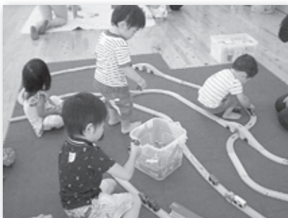
おひさま広場 おもちゃであそんだよ

とき 10月3日(水) 10:00～11:30 ところ 神崎支庁舎 対象 子育て中の保護者と子ども。 (おじいさん・おばあさんもお孫さんと一緒にどうぞ) 内容 たくさんのおもちゃで自由に遊べます。 子育ての相談も受け付けています。 子育てワンポイント講座 「絵本を100倍たのしむ方法」 参加費 無料 持ち物 お茶