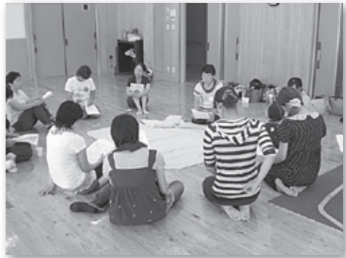
おひさま広場 子育てワンポイント講座