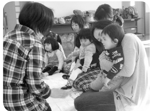
0歳 わらべうたあそび