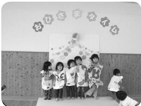
おひさまタイム 手作り衣装でハイポーズ!

とき 3月5日(水) 10:00～11:30 ところ きらきら館 対象 子育て中の保護者と子ども。グループ活動に入られていない方も、参加できます。(おじいさん・おばあさんもお孫さんと一緒にどうぞ) 内容 たくさんのおもちゃで、自由に遊べます。子育ての相談も、受け付けています。 参加費 無料 持ち物 お茶