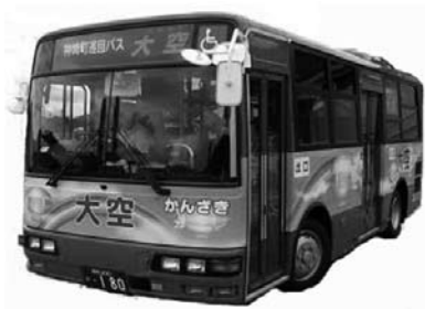
神河町コミュニティバス