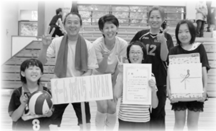
3位 (チームかずいちJAPAN)