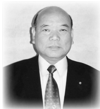
（平成25年5月8日ご逝去）

谷川さんは生前、地方自治への功績に対し、兵庫県知事表彰、自治大臣表彰（現総務大臣表彰）など数多くの章を受賞されるとともに、旭日双光章の叙勲を受章されており、このたびのご逝去に伴い正六位の位階（叙位）を授けられました。多大な功績に対し改めて敬意と感謝を表します。