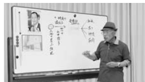
鈴木先生・ノーベル賞の話