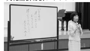
黒田先生「八重の桜」の話