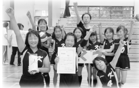
準優勝 ( K 2 )