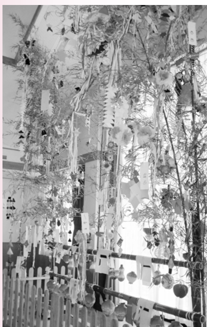
きらきら館でのたなばたまつり