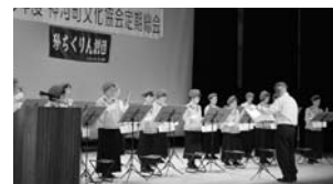
文化協会総会アトラクション