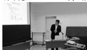
睦の家・太田施設長の話